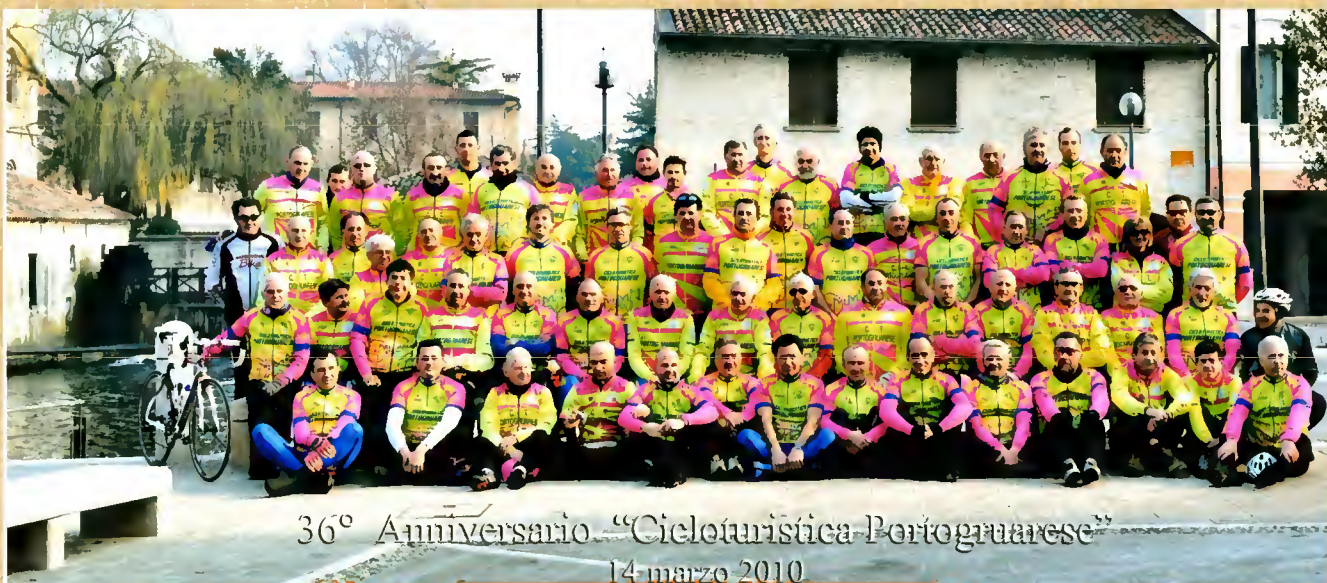
36° Anniversario "Cicloturistica Portogruarese" 14-marzo-2010