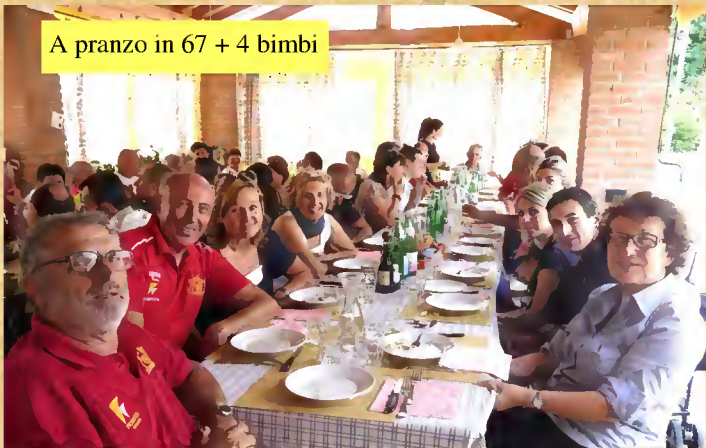
A pranzo in 67 + 4 bimbi