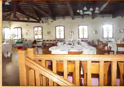
Ristorante "Villa Curtis Vadi"

compiti. Ringrazio i soci e non soci che con impegno si mettono a disposizione della Cicloturistica Portogruarese e grazie a loro le nostre uscite e gite sociali riescono bene. Devo sottolineare che in quest'anno c'è stato un incremento di nuovi soci e questo fa onore alla C.T. Portogruarese. Talvolta possiamo anche sbagliare e non accontentare tutti ma le intenzioni sono sempre a fin di bene. Nelle varie uscite c'è stata una maggior partecipazione di famigliari e amici a seguito e questo è lo spirito della Portogruarese., che le nostre manifestazioni sociali siano occasione di integrazione, amicizia e allegria. Faccio anche notare le difficoltà che abbiamo durante certe manifestazioni, certo tutti abbiamo i nostri problemi, ma se ci fosse un po' più di disponibilità saremmo più uniti e consapevoli di far parte di questo gruppo. Scusatemi se sembro retorico ma in questi anni in cui faccio parte di questa società come consigliere e come presidente, a lavorare e a promuovere iniziative e portarle a termine sono sempre le stesse persone, mi piacerebbe che in futuro ci fosse più collaborazione. Ringrazio quelle persone della Portogruarese che in più occasioni si sono distinte per l'impegno e collaborazione verso altre società dalle quali ho ricevuto ringraziamenti sinceri. Vo-