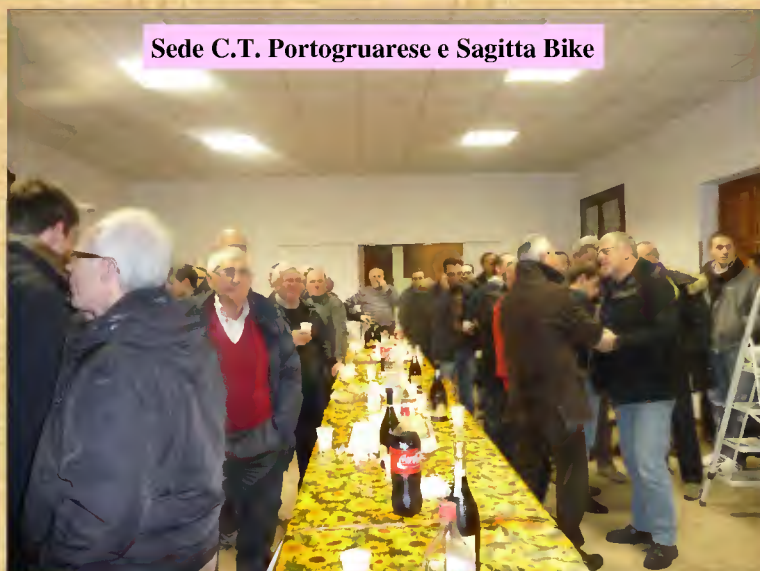
Sede C.T. Portogruarese e Sagitta Bike